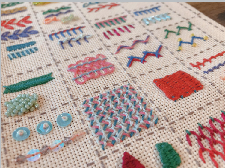
TAUDAD 【刺繡設計理論與應用基礎 - 精修證書班】