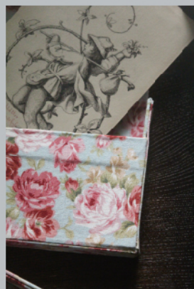
TAUDAD 【布盒設計應用與打版製作 - 精修證書班】