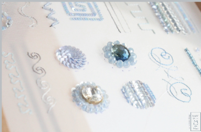
TAUDAD 【法式鉤針刺繡基礎針法與應用 - 精修證書班】